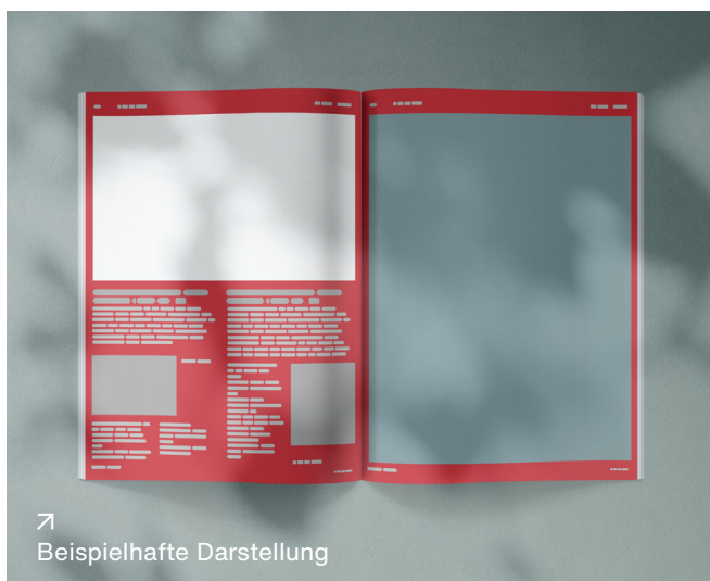
↗ Beispielhafte Darstellung

Statt 19.900 € nur 11.940 € für 2/1 Seite